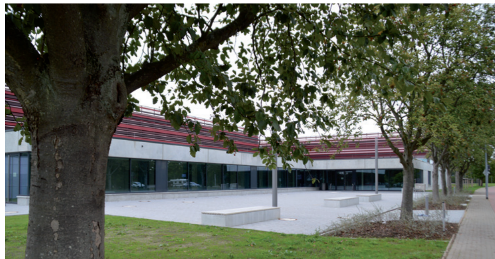
Unsere neuen Sporthallen