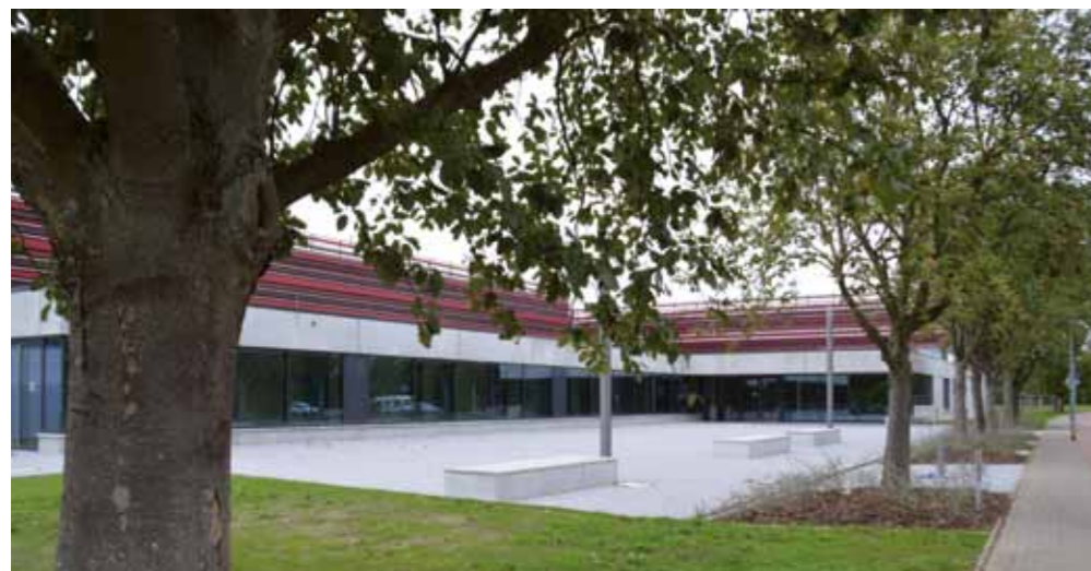
Unsere neuen Sporthallen